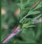
Tige velue et rougeâtre