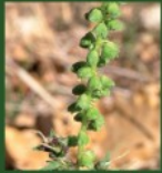
Fleurs mâles sur de longs épis