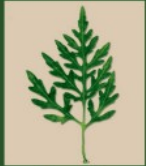
Feuille profondement découpée